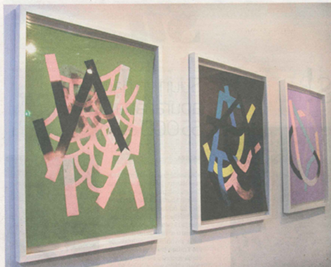
Jaime Angelopoulos, Calciate, Bewitch ja Detonate , 2015, kuivapastelli ja öljypastelli paperilla.